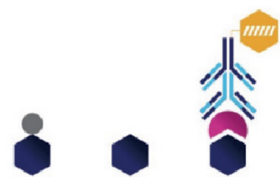
Ligand Binding Assay 抗體藥物開發新選擇