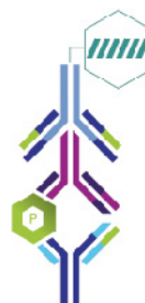
Phosphorylation ELISA 專一性測定單一磷酸化訊號