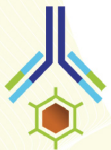
Cell-based ELISA 從細胞實驗到磷酸化訊號偵測一氣呵成