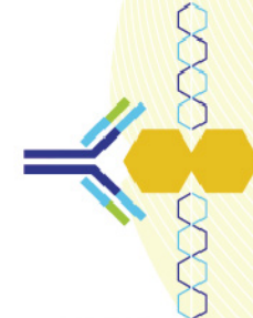
Transcription Factor Activity Assays 探索 Transcription Factor 最直接偵測方式