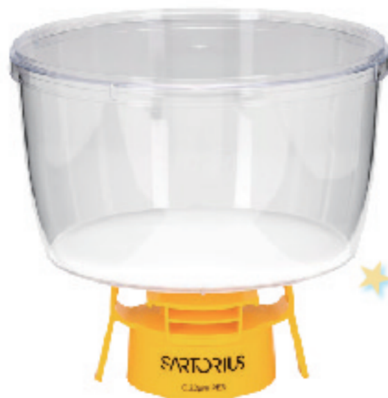
Sartolab® BT 500, 500 mL #180E14-E