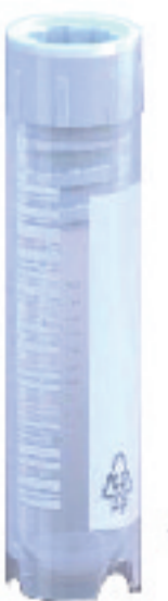
2 mL 內旋小管 #CL2ARBIPSTS