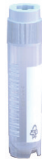
2 mL 外旋小管 #CL2ARBEPSTS