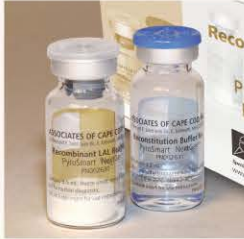
# PNG050 (50 tests)