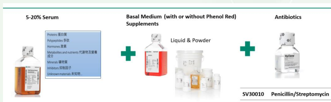
圖一 培養基組成一般由操作者依據不同細胞株進行半客製化。

細胞由於沒有細胞壁，因此對於大部分的抗生素具有抵抗性。剛分離的細胞有潛在汙染源或是怕環境、操作造成汙染時，可以添加抗生素在培養基中做為預防性措施。一般針對細菌汙染常用的是 penicillin/streptomycin 二合一混合液，若是對於真菌/酵母菌可以選用 penicillin/streptomycin/amphotericin B 三合一混合液。